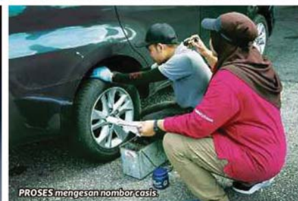
PROSES mengesan nombor casis.

dirujuk ke Jabatan Kimia. 4. Setelah laporan kimia diperoleh, jika terdapat gangguan pada nombor berkaitan, kenderaan akan dilarang lesen.