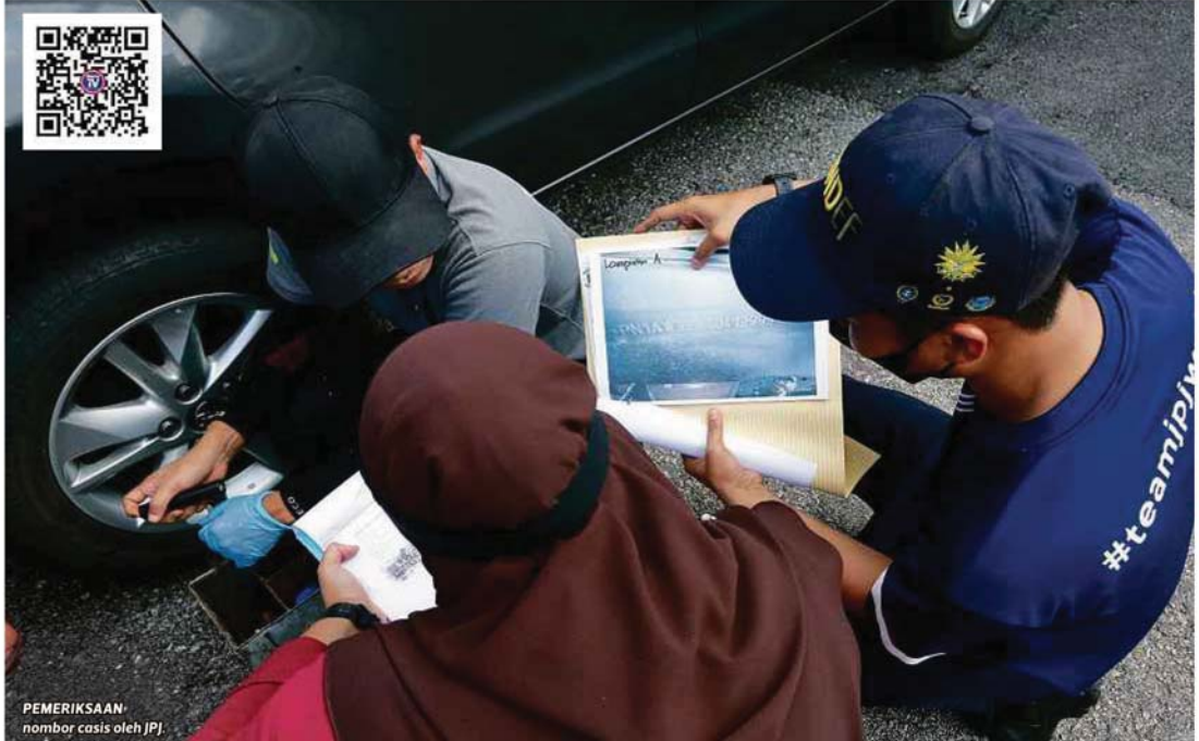
PEMERIKSAAN nombor casis oleh JPJ

juga, terdapat status meragukan dalam sistem JPJ seperti nama pemilik tidak sama dengan sijil pemilikan kenderaan serta nombor pendaftaran kenderaan berbeza dengan apa yang didaftarkan untuk casis," katanya.