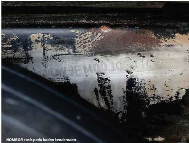
NOMBOR casis pada badan kenderaan.

Mestilah terang, jelas serta tidak diusik dan sekiranya ada, kenderaan berkaitan boleh disita