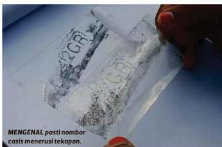
MENGENAL pasti nombor casis menerusi tekanan.