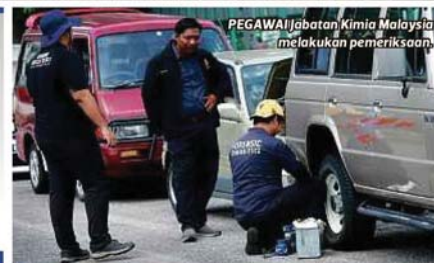
PEGAWAI Jabatan Kimia Malaysia melakukan pemeriksaan.